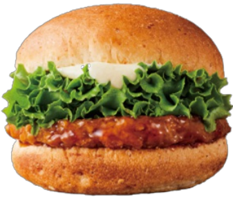
THE GOOD BURGER(テリヤキ)

100%植物性由来の大豆パティをテリヤキソースに絡め、低糖質バンズで挟んだ『THE GOOD BURGER (テリヤキ)』。2020年9月の販売開始以来、日本ならではの醤油麹をベースとしコクと奥行きのある味わいのテリヤキソースが好評を博し、予想を上回る売り上げを記録。お客様の声にお応えし、この度継続販売が決定いたしました。