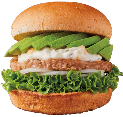
THE GOOD BURGER(アボカド)