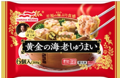
黄金の海老しゅうまい