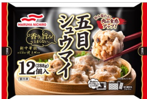
五目シュウマイ 香りと旨み